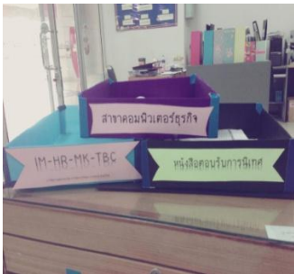
ภาพ กล่องใส่เอกสารจากฟิวเจอร์บอร์ด